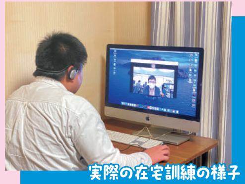
実際の在宅訓練の様子

…など、いろいろな不安を抱えている方の為にパソコンの基本動作から丁寧に指導!!資格取得、就労などなど個人の目的や、習熟度に合わせて様々な内容の訓練を提供することができます。お住まいの地域により在宅で訓練を受けられる場合もありますのでご相談下さい。