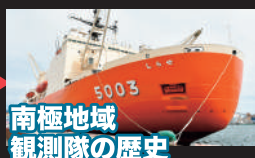
南極地域 観測隊の歴史