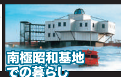
南極昭和基地 での暮らし