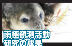
南極観測活動 研究の成果