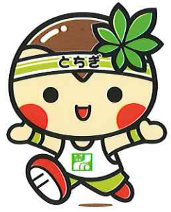
とちまるくん